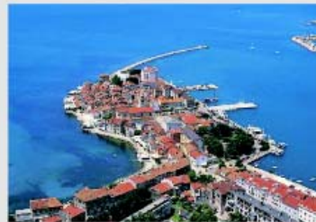
2x im Jahr (Pfingsten und Sommer)

Genauere Infos auf unserer Homepage oder fordern Sie unseren kostenlosen Katalog an.