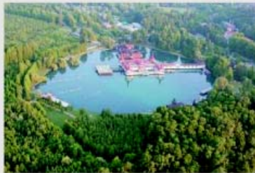
Tischtennis in erholsamer Umgebung. Bad Héviz ist durch den ältesten und größten Thermalsee Europas bekannt.