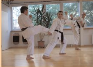
Shorin Ryu Seibukan Karate